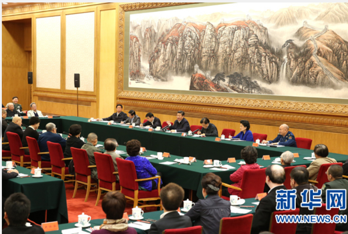
2014年10月15日，中共中央总书记、国家主席、中央军委主席习近平在北京主持召开文艺工作座谈会并发表重要讲话。