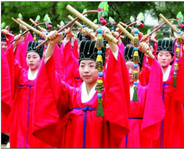
资料图片：2006年3月9日，在韩国首都首尔，大学生们身着传统服装参加祭孔仪式。韩国预计今年将在中小学普遍开设汉语课程。

自中国政府于2005年9月提出促进和谐世界的外交政策以来，国内有关软实力的讨论越来越多。在《环球时报》的《国际论坛》版，笔者已发表过两篇有关软实力的文章。近来笔者发现，“软实力”这一概念被越来越多的人理解为是“文化实力”。为此，笔者就软实力核心要素及如何增强我国软实力问题做进一步讨论。