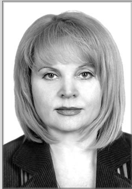
Элла Александровна Памфилова, старший научный сотрудник Центра исследования гражданского общества и некоммерческого сектора Национального исследовательского университета «Высшая школа экономики»; министр социальной защиты населения России (1991–1994), председатель Совета при президенте Российской Федерации по содействию развитию институтов гражданского общества и правам человека (2004–2010)

Наиболее выпукло эта мировоззренческая сумятица проявляется в расколовших общественное мнение неутихающих спорах по поводу Сталина. В проведенном недавно опросе телезрителей федерального 5-го канала 71,5% дозвонившихся на вопрос «Кто для вас Сталин?» ответили: «великий вождь», менее 18% – «наша история», и только