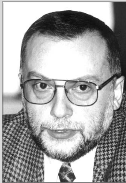
Владимир Георгиевич Папав, доктор экономических наук, профессор, член-корреспондент Национальной академии наук Грузии, Senior Fellow at the Georgian Foundation for Strategic and International Studies, главный научный сотрудник Института экономики имени Паата Гугушвили Тбилисского государственного университета имени Иванэ Джавахишвили; был министром экономики (1994–2000) и членом парламента Грузии (2004–2008)